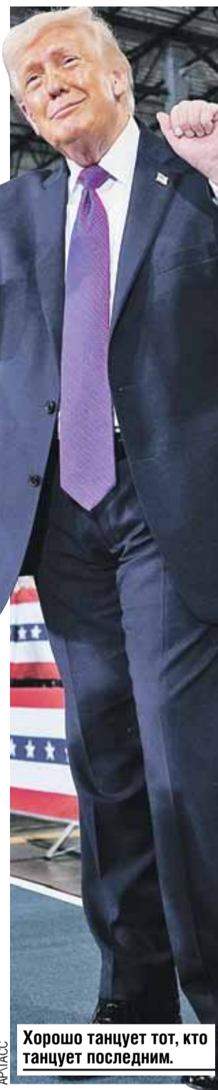
Хорошо танцует тот, кто танцует последним.

Рейтинг президента, обещавшего, что не устроит ни одной войны, сейчас ниже на десять пунктов, чем у его предшественника, которого с позором изгнали из Белого дома. Ричарда Никсона попросили уйти в 1974 году с показателем минус 36 пунктов. У Джорджа Буша с его иракской войной было минус 37 пунктов, тогда ему хотели объявить импичмент. Так что обстановка в Белом доме сейчас горячая.