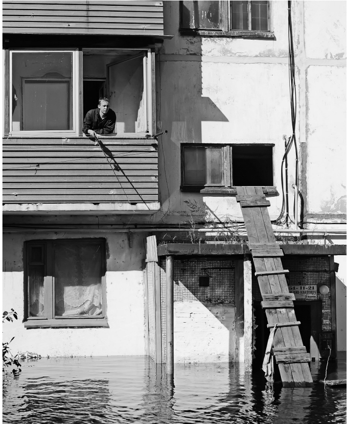
Люди в огородах и во дворах ловили рыбу

Встречаем крепкого мужика в комбинезоне, руки его перепачканы машинным маслом. Он сам проявляет инициативу, узнав, что в поселок приехали журналисты.