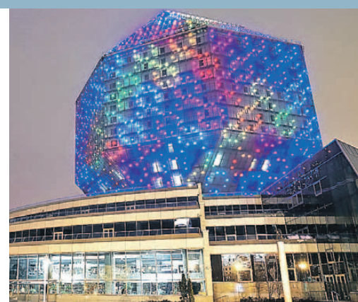
У Национальной библиотеки Беларуси самая красивая подсветка в Минске, но и ее ненадолго выключили.

Москва, как и Минск, участвовала в акции уже восьмой год подряд. Первым погас Кремль, потемнели соседние ГУМ, храм Василия Блаженного и Красная площадь. В это время на Васильевском спуске защитники природы выложили из свечей цифру «60+» в честь часа без света и фразу «Год экологии». Оттуда же начался пробог «Велосветлячки», который организовали участники движения «Русвелос». 500 велосипедистов пронесли по темным улицам с зажженными фарами. Свет также сэкономили в Московском планетарии, Доме правительства и Госдуме.