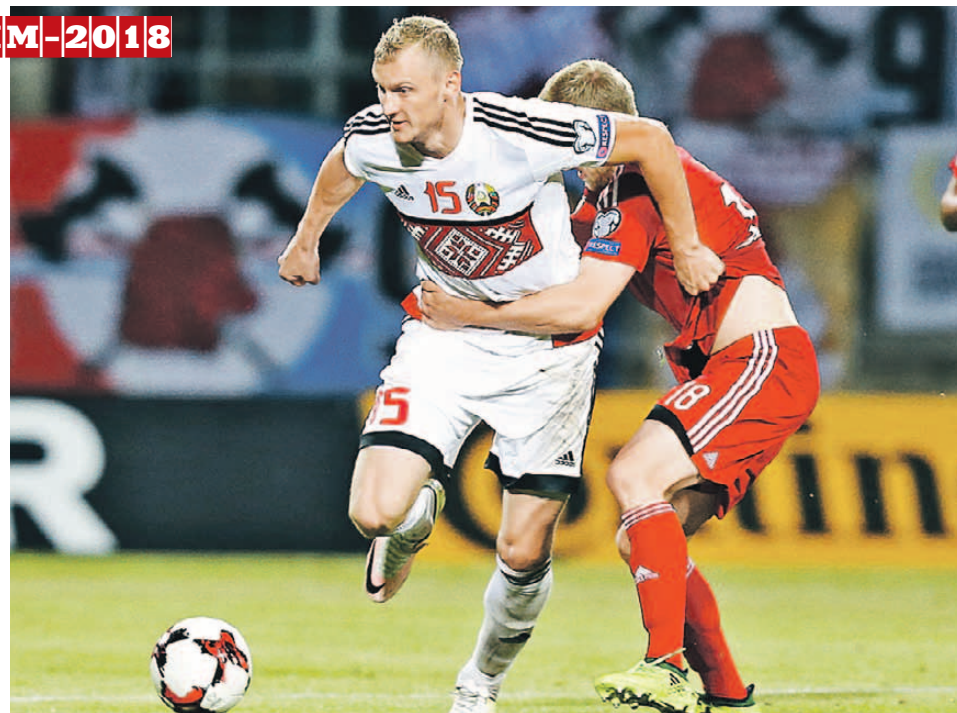
Белорусы не смогли прорваться через отборочное сито.

Самое главное, российские фанаты гарантированно увидят среди участников свою сборную. О чем белорусским болельщикам, увы, остается пока только мечтать.