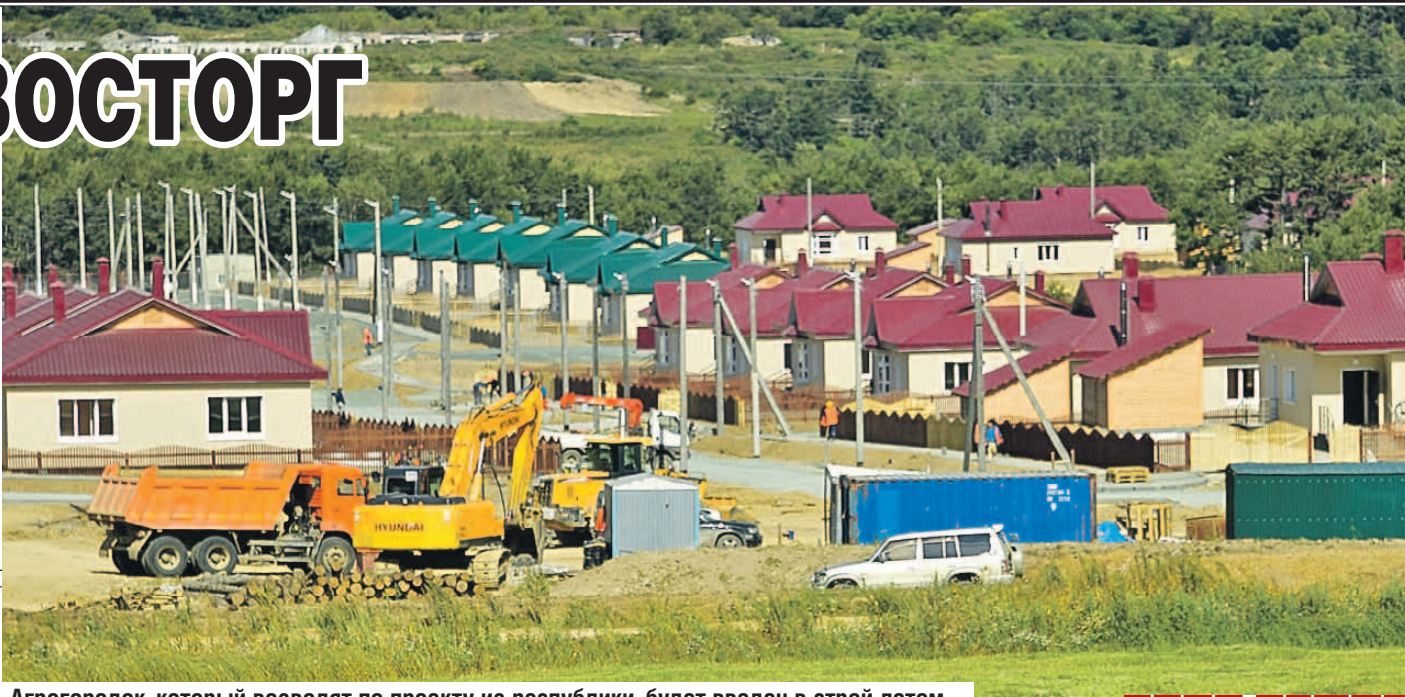
Агрогородок, который возводят по проекту из республики, будет введен в строй летом 2018 года. Одной молочной фермой дело не ограничится - здесь создают еще и перерабатывающее производство.