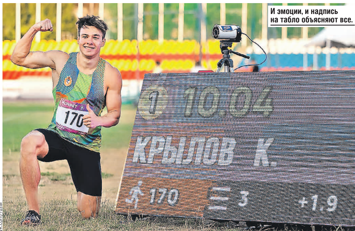
И эмоции, и надпись на табло объясняют все.

товых колодках, а с первых же метров рванул во всю мощь на предельном форсаже, сразу превратив всех соперников просто в участников. Ближайшему из них он привез отрыв к финишному створу метров пять - семь, а то и все десять. На стометровке это космос. А когда на табло зажглись его победные секунды, трибуны восторженно ахнули. Так быстро у нас и в советские времена не бегал еще никто и никогда. Даже легендарный Валерий Борзов выиграл олимпийское «золото» в Мюнхене-1972 с результатом 10,07.