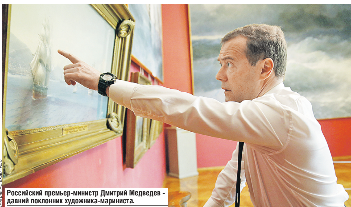
Российский премьер-министр Дмитрий Медведев - давний поклонник художника-мариниста.

Самая масштабная выставка - к 200-летию со дня рождения Ивана Айвазовского - откроется 29 июля . Картины русского художника-мариниста привезут в Москву из музеев со всей России и ближнего зарубежья. Главная интрига: сумеет ли ретроспектива побить рекорды нашумевшей выставки Серова, когда люди часами стояли в очередях?