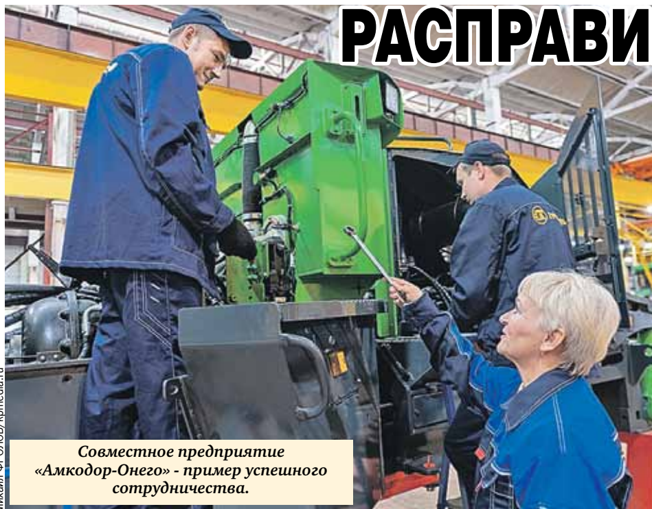
Совместное предприятие «Амкор-Онего» - пример успешного сотрудничества.