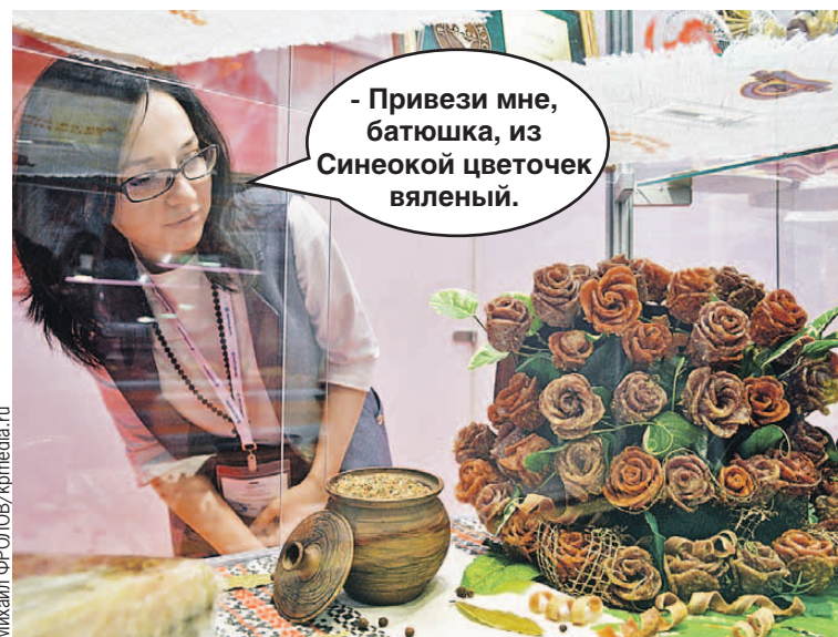
- Привези мне, батюшка, из Синеокой цветочек вяленый.

За 25 лет местечковые смотрины продовольствия превратились в крупнейшую международную выставку продуктов. В этом году традиционный зимний фестиваль собрал почти 2,5 тысячи компаний из более шестидесяти стран мира. У Синеокой традиционно самое широкое представительство среди стран СНГ.