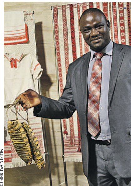
Представитель дипмиссии Буркина-Фасо ушел с презентации с лаптями: в его стране таких не плетут.