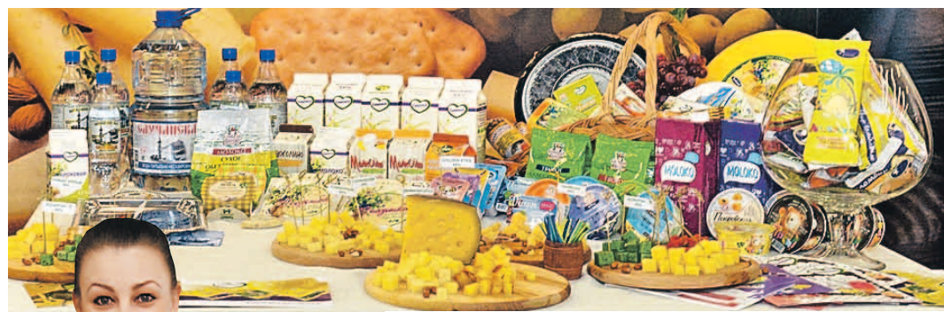
Вот они, белорусские деликатесы: столько сортов сыров, что и Франции конкуренцию составить можно.

Новинками минчане хвастаться не устают. «Белкоммунмаш» представил свою гордость - бесконтактный троллейбус. Для него даже провода прокладывать не надо. Такие машины курсируют уже по городам Беларуси, а скоро приедут в Москву и Санкт-Петербург. Кстати, московские аэроэкспрессы тоже делаются на этом предприятии.