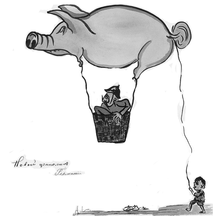
Новый цеппелин Германии