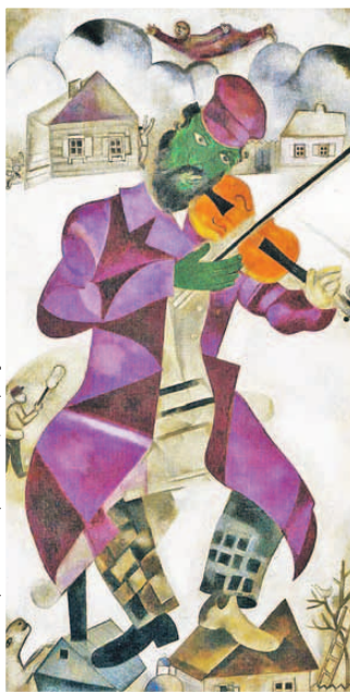
«Зеленый скрипач», Марк Шагал/Репродукция

В Витебске есть еще второй «музей Шагала», как называют его гости города. Это Арт-центр художника. По случаю юбилея там устроили выставку «130 лет - 130 шедевров».