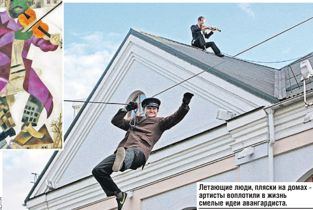
Летающие люди, пляски на домах - артисты воплотили в жизнь смелые идеи авангардиста.