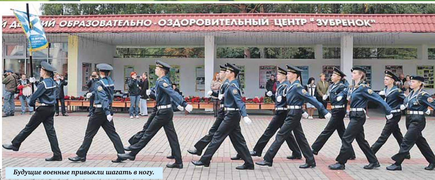
Будущие военные привыкли шагать в ногу.