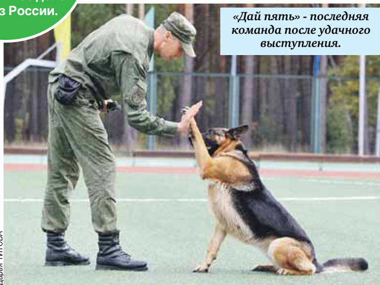
«Дай пять» - последняя команда после удачного выступления.

За пятнадцать лет в «Зубренке» побывало больше 6,5 тысячи школьников со всей Беларуси и 250 делегаций из России.