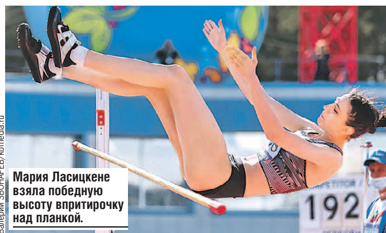
Мария Ласицкене взяла победную высоту в прыжке над планкой.

- Рассчитывала прыгнуть выше. Но это мой первый старт в текущем, весьма странном сезоне, более того, первый мой