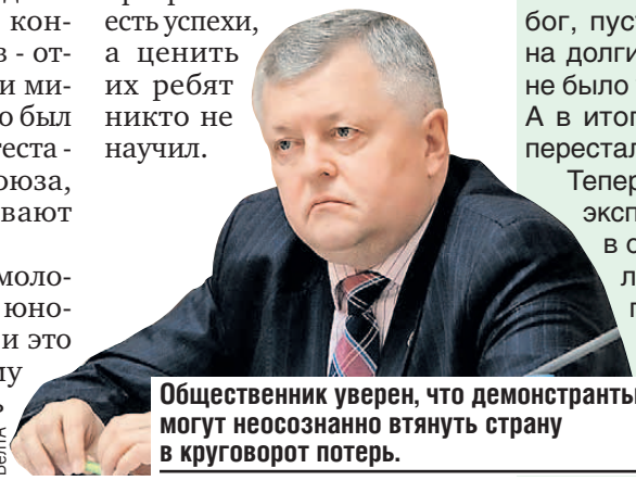
Общественник уверен, что демонстранты могут неосознанно втянуть страну в круговорот потерь.

молодежи обучается по самым различным программам в высших учебных заведениях Польши, Литвы, Латвии, Германии. Как пример - пресловутая карта поляка, триста тысяч белорусов ее получили. Образование, кругозор, хорошо - но где тут забота о Родине? Почему не сделать, условно, гражданский «паспорт Союзного государства» и показать достижения России? Их уж побольше, чем в Польше. В том числе по программам СНГ есть успехи, а ценить их ребят никто не научил.