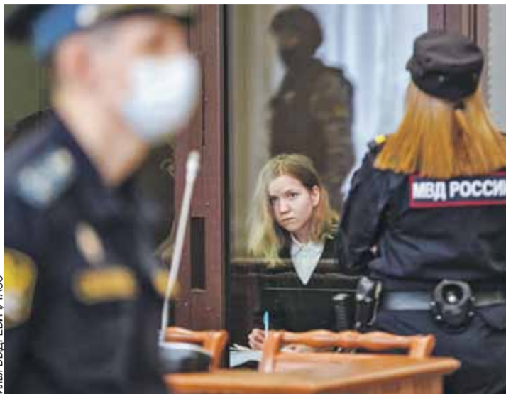
Преступница надеется, что суд поверит в ее наивность.

Напомним, что Трепова замешана в совершении теракта в кафе на Университетской набережной, которое произошло в апреле. Она принесла заминированную статуэтку на встречу Татарского с поклонниками. В результате взрыва публи-