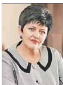
ГЕРМАНОВА Ольга Михайловна (Государственная Дума)