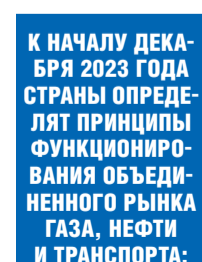
К НАЧАЛУ ДЕКАБРЯ 2023 ГОДА СТРАНЫ ОПРЕДЕЛЯТ ПРИНЦИПЫ ФУНКЦИОНИРОВАНИЯ ОБЪЕДИНЕННОГО РЫНКА ГАЗА, НЕФТИ И ТРАНСПОРТА: АВИАЦИОННОГО, ЖЕЛЕЗНОДОРОЖНОГО, ВОДНОГО И АВТОМОБИЛЬНОГО.