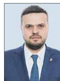
ТУРОВ Артем Викторович Председатель Комиссии (Государственная Дума)