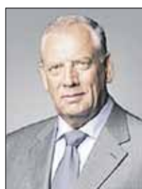
МИТИН Сергей Герасимович Председатель Комиссии (Совет Федерации)