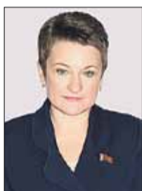
МАКАРИНА-КИБАК Людмила Эдуардовна Зампредседателя Комиссии (Палата представителей)