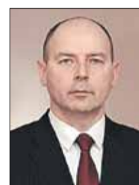
КУШНАРЕНКО Алексей Иванович Председатель Комиссии (Совет Республики)