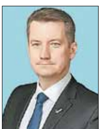
ГЕТТА Антон Владимирович (Государственная Дума)