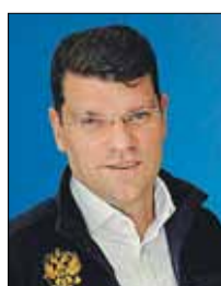
КРАВЧЕНКО Денис Борисович (Государственная Дума)