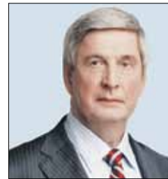
МЕЛЬНИКОВ Иван Иванович Заместитель Председателя Парламентского Собрания (Государственная Дума)