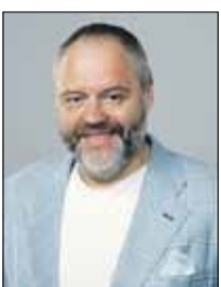
НОВИЧКОВ Николай Владимирович (Государственная Дума)