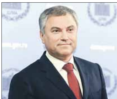
ВОЛОДИН Вячеслав Викторович Председатель Парламентского Собрания, Председатель Государственной Думы Федерального Собрания РФ