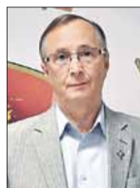
БУРЛЯЕВ Николай Петрович Председатель Комиссии (Государственная Дума)