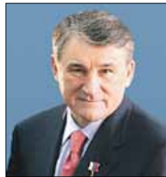
ВОРОБЬЕВ Юрий Леонидович Заместитель Председателя Парламентского Собрания (Совет Федерации)