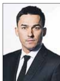
БАСКОВ Дмитрий Юрьевич (Совет Республики)