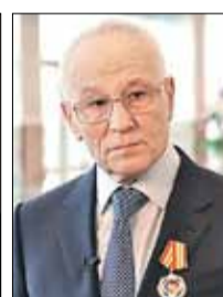
РАПОТА Григорий Алексеевич Зампредседателя Комиссии (Совет Федерации)