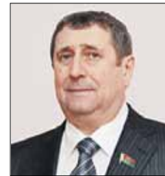
РУСЫЙ Михаил Иванович Заместитель Председателя Парламентского Собрания (Совет Республики)