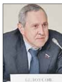
БЕЛОУСОВ Вадим Владимирович (Государственная Дума)