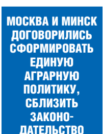
МОСКВА И МИНСК ДОГОВОРИЛИСЬ СФОРМИРОВАТЬ ЕДИНУЮ АГРАРНУЮ ПОЛИТИКУ, СБЛИЗИТЬ ЗАКОНОДАТЕЛЬСТВО В ОБЛАСТИ СЕЛЬСКОГО ХОЗЯЙСТВА, ЧТОБЫ УВЕЛИЧИТЬ ОБЪЕМЫ ВЗАИМНОЙ ТОРГОВЛИ.