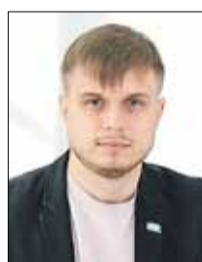
ТКАЧЕВ Антон Олегович (Государственная Дума)