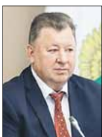
КАШИН Владимир Иванович Зампредседателя Комиссии (Государственная Дума)