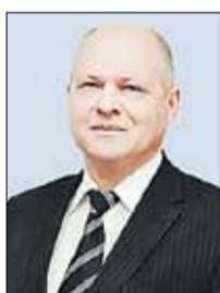
БРИЧ Леонид Григорьевич Зампредседателя Комиссии (Палата представителей)