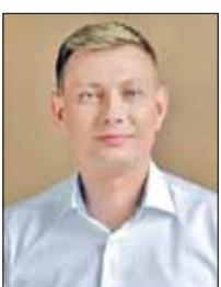
ПЛЯКИН Владимир Владимирович (Государственная Дума)