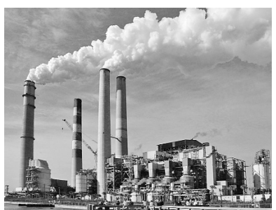
Цесс сооружения атомной станции начнется в сентябре 2011 года.

10 февраля Беларусь начала переговоры с Министерством финансов России о предоставлении кредита на строительство АЭС. По словам главы «Росатома» Сергея Кириенко, межправительственное соглашение о сотрудничестве России и Беларуси по вопросу строительства АЭС будет подписано до конца первого квартала 2011 года. При этом С. Кириенко отметил, что если все работы с белорусской стороны будут завершены, то про-