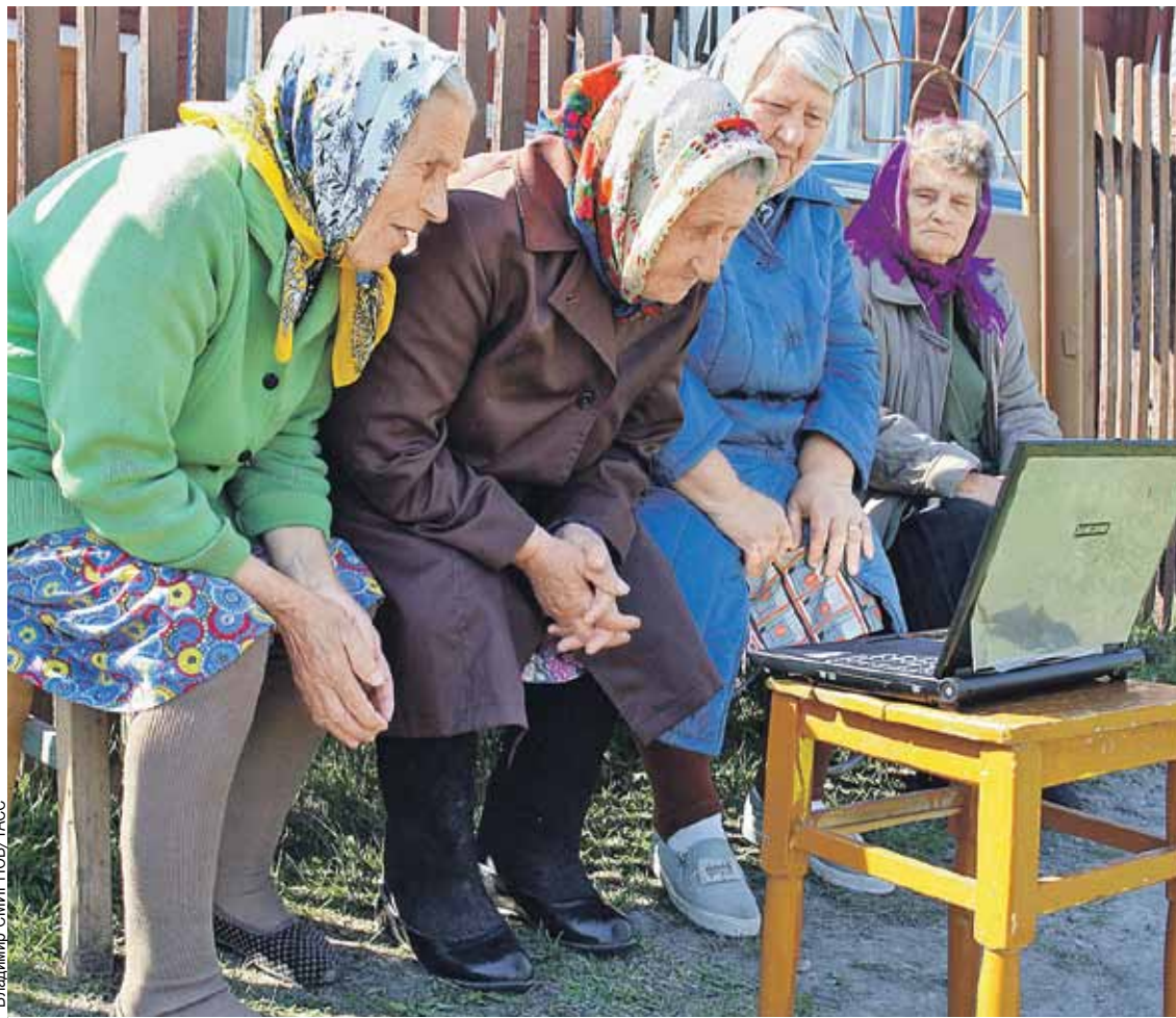
Новые «белорусские бабки» и после выхода на пенсию стараются не отстать от жизни.

Быть повышению или не быть - подскажет соцопрос