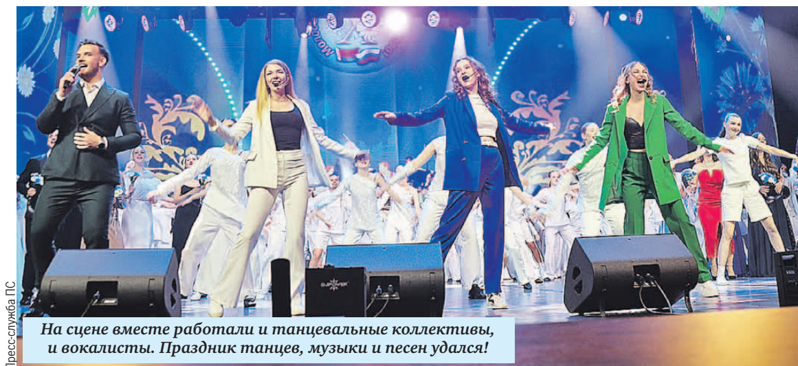
На сцене вместе работали и танцевальные коллективы, и вокалисты. Праздник танцев, музыки и песен удался!