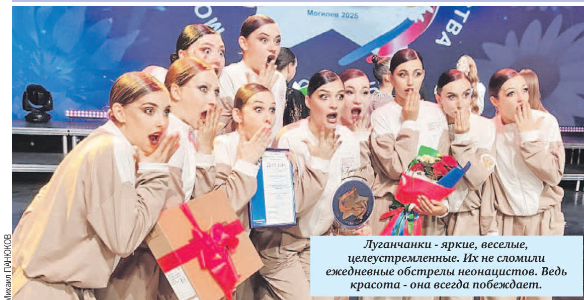
Луганчанки - яркие, веселые, целеустремленные. Их не сломили ежедневные обстрелы неонацистов. Ведь красота - она всегда побеждает.