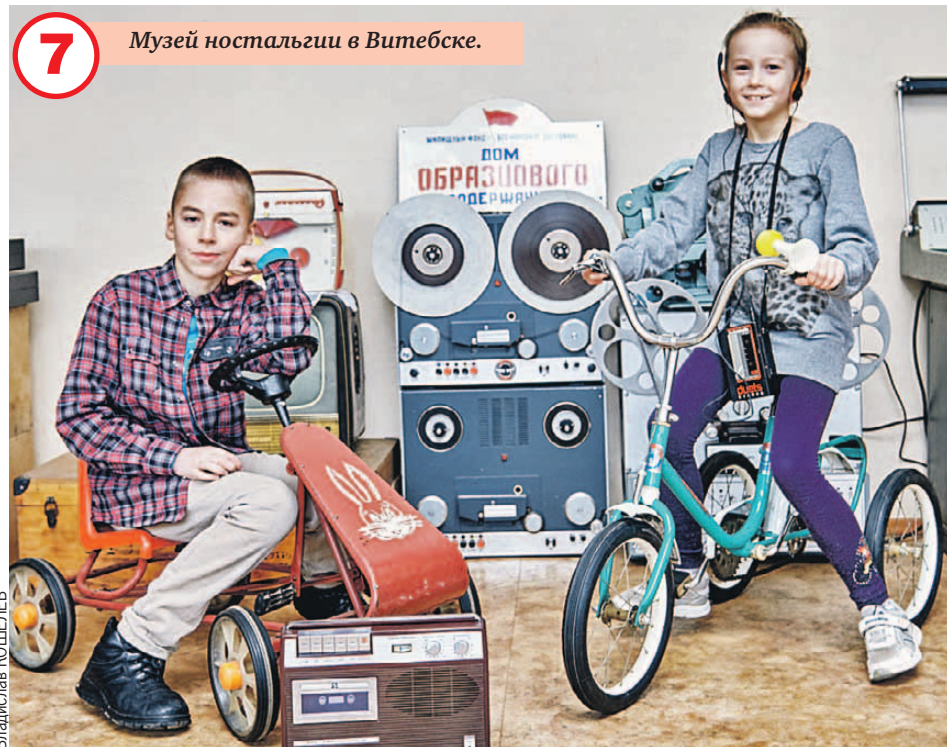
Музей ностальгии в Витебске.