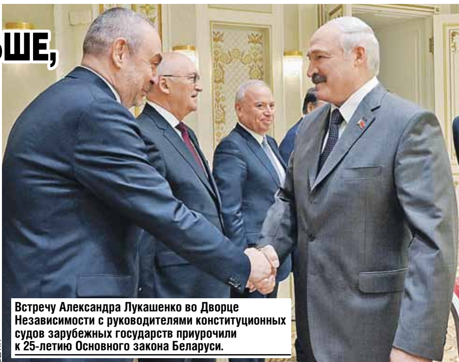
Встречу Александра Лукашенко во Дворце Независимости с руководителями конституционных судов зарубежных государств приурочили к 25-летию Основного закона Беларуси.

Александр Лукашенко вернулся к вопросу конституционной реформы.