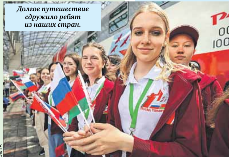
Долгое путешествие сдружило ребят из наших стран.

В 2023 году проект сделают еще более масштабным, расширят его географию, соберут ребят уже из пяти государств ЕАЭС.