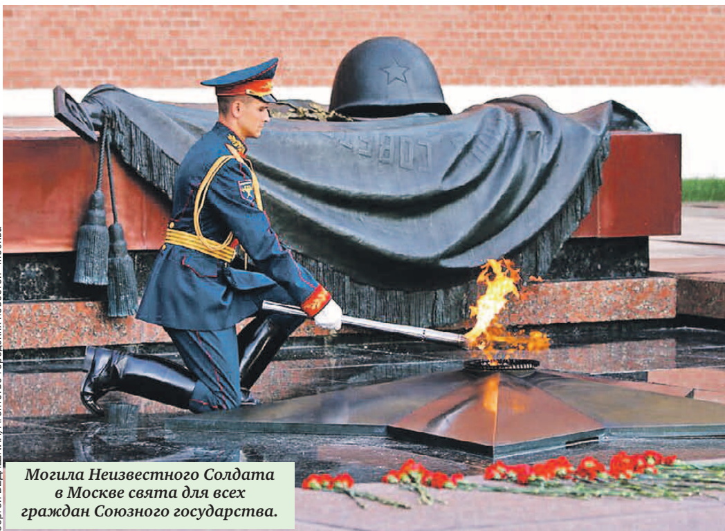
Могила Неизвестного Солдата в Москве свята для всех граждан Союзного государства.