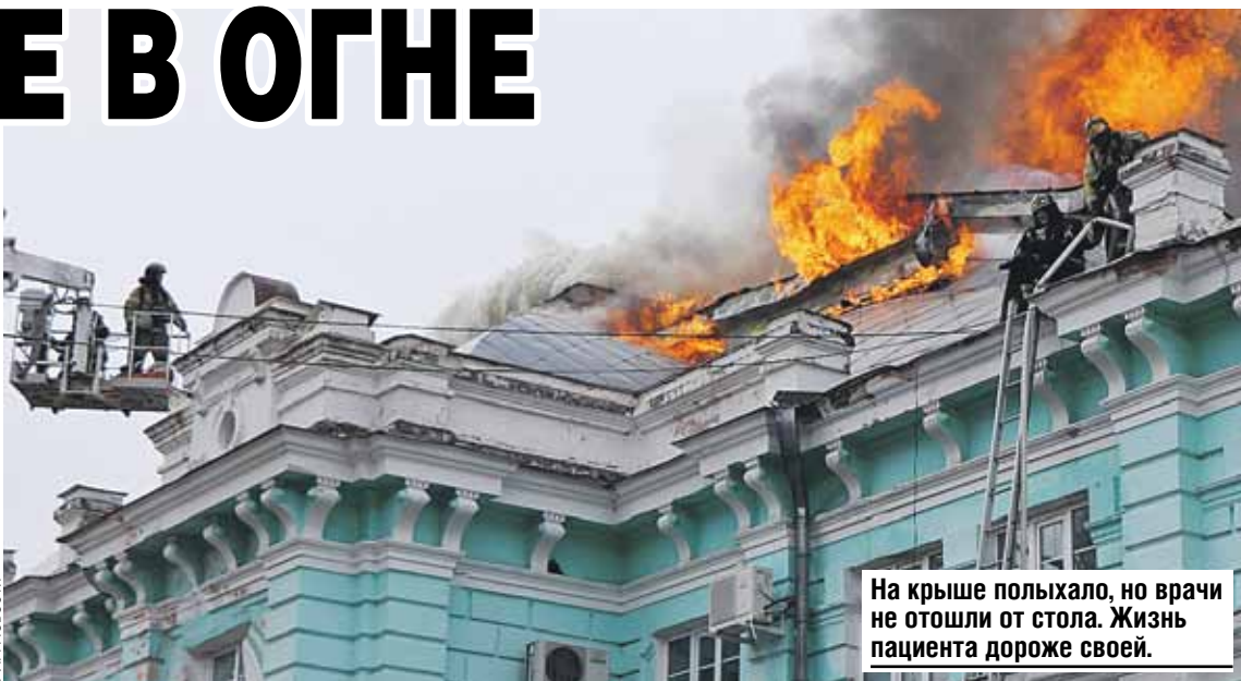
На крыше полыхало, но врачи не отошли от стола. Жизнь пациента дороже своей.

Аортокоронарное шунтирование - штука сложнейшая. Крайне. Его применяют при сильном поражении сосудов для восстановления нормальной кровотока. Операция началась в десять утра. А уже в полдень в экстренные службы Благовещенска стали поступать первые тревожные сообщения о пожаре в кардио-центре. Пламя на крыше пля-