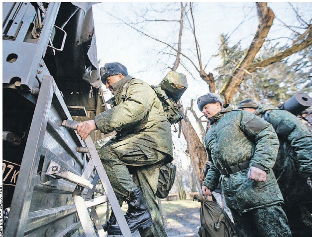
В Синеокой на 35-дневные учения призывают резервистов до пятидесяти лет, в России - до шестидесяти на два месяца.

По его словам, правильно призывать граждан запаса на военные сборы.