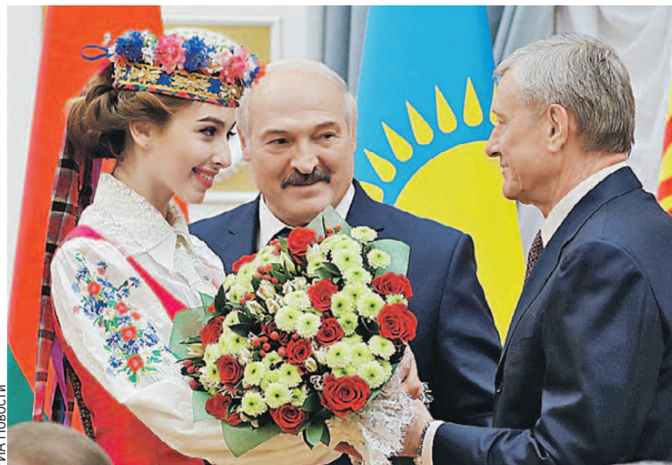
На саммите ОДКБ в Минске Александр Лукашенко вручил бывшему генсеку организации Николаю Бордюже награду за многолетний труд (подробнее о форуме на стр. 6 - 7).

сеть лидеров в сфере машиностроения. Продаются продукты питания, товары народного потребления и легпрома.