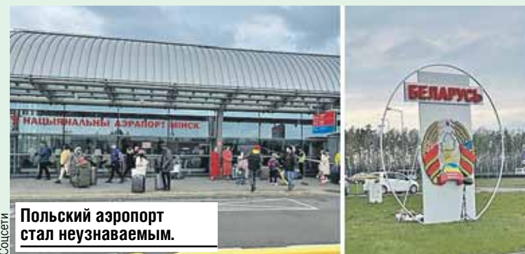
Польский аэропорт стал неузнаваемым.