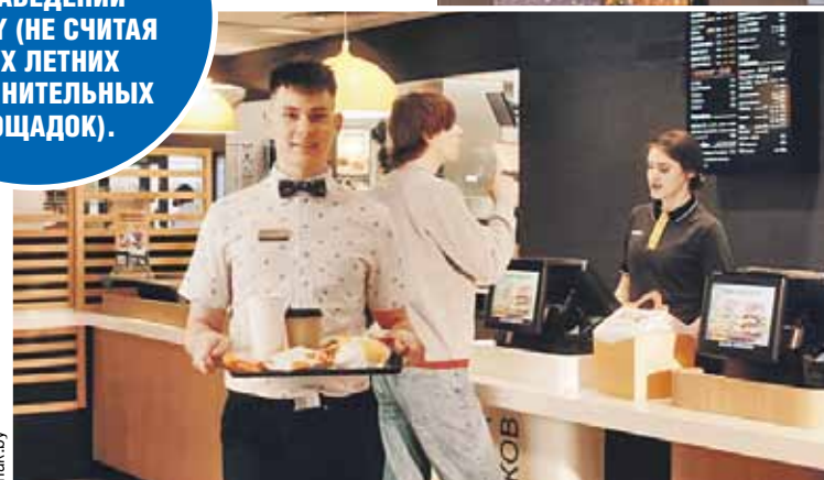
Бургер «Родны» и «Беларускі» - наш ответ американским «макчикенам».

КСТАТИ СЕЙЧАС В РЕСПУБЛИКЕ 25 ЗАВЕДЕНИЙ МАК.ВУ (НЕ СЧИТАЯ ДВУХ ЛЕТНИХ ДОПОЛНИТЕЛЬНЫХ ПЛОЩАДОК).