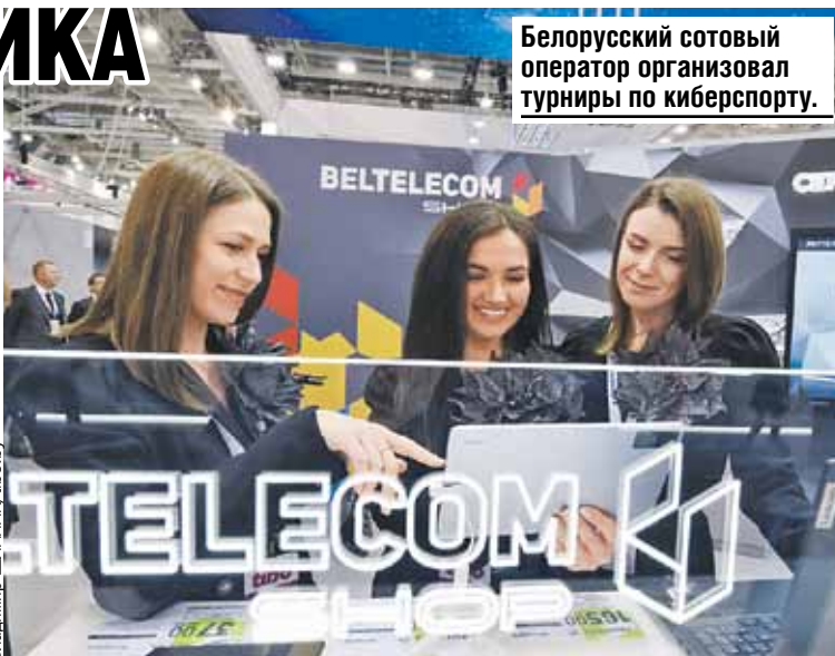
Белорусский сотовый оператор организовал турниры по киберспорту.