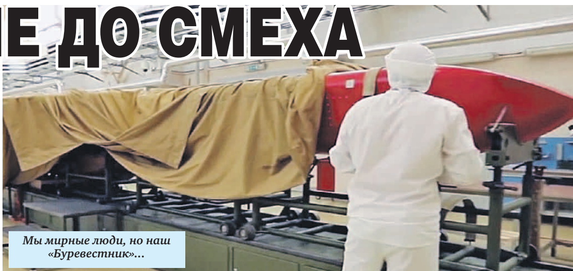
Мы мирные люди, но наш «Буревестник»...

уникальных боевых систем впервые рассказал в 2018 году в Послании Федеральному собранию Владимир Путин. На Западе, помнится, многие отнеслись к этому скептически. Теперь уже не смеются.