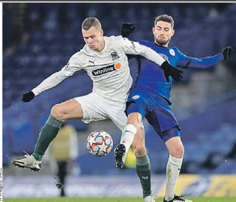
На закуску порадовал «Краснодар»: прибил на своем поле совсем глухого аутсайдера французский «Ренн», а в последнем туре сыграл вничью с «Челси» в Лондоне.