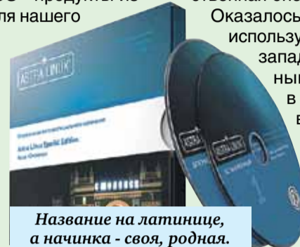
Название на латинице, а начинка - своя, родная.

Оказалось, что она есть. Ее с успехом использует армия. Массовая замена западного софта на отечественный гражданский началась в 2020 году. Прежде всего - в госорганах. Официальной системой стала операционная система Astra Linux. Ее с 2008 года разрабатывала и внедряла российская компания «Русбитех».