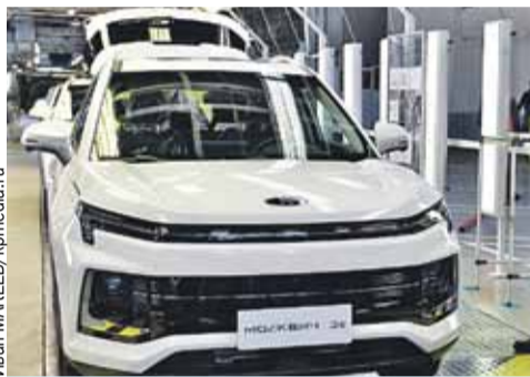
Столичный автогигант начал новую жизнь.

- Поезда серии - один из лучших примеров успешного импортозамещения. В сборке используют преимущественно отечественные детали и оборудование, - рассказал мэр Москвы Сергей Собянин.