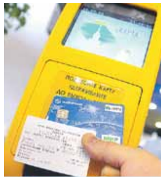
Карты стали одним из первых ответов санкциям.

Уже выпустили 229 миллионов карточек этого платежного средства. И принимают их к расчету не только в России, но и в почти двадцати странах мира. В том числе и в братской Беларуси.