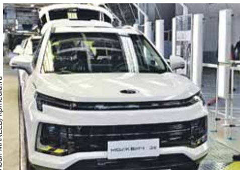
Столичный автогигант начал новую жизнь.

- Поезда серии - один из лучших примеров успешного импортозамещения. В сборке используют преимущественно отечественные детали и оборудование, - рассказал мэр Москвы Сергей Собянин.