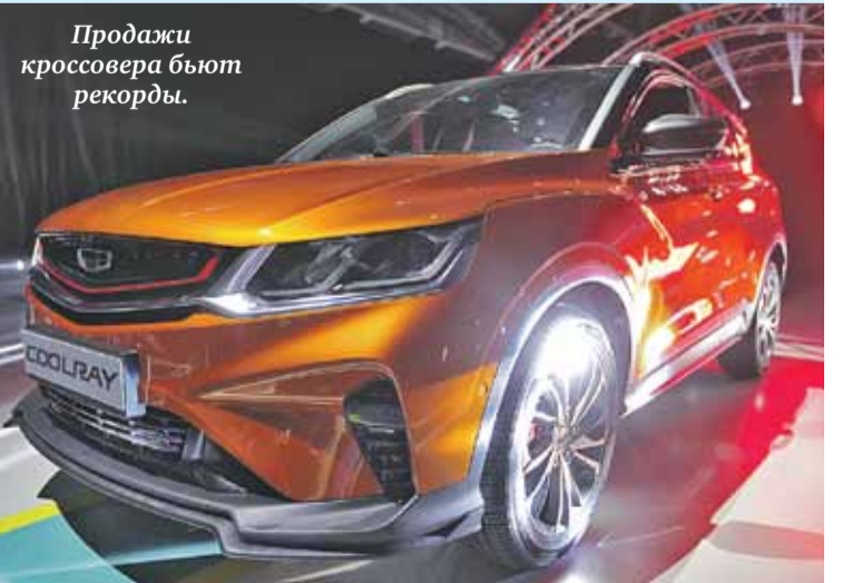
Продажи кроссовера бьют рекорды.