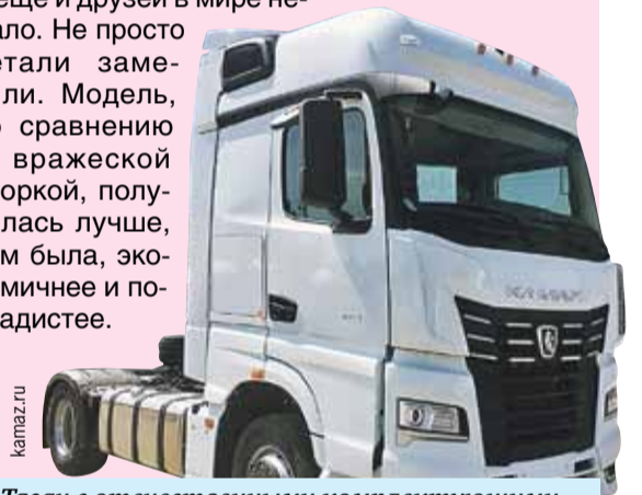
Тягач с отечественными комплектующими лучше импортного.

Но - широка Россия, и заводов в ней много. А еще и друзей в мире немало. Не просто детали заменили. Модель, по сравнению с вражеской сборкой, получилась лучше, чем была, экономичнее и полкадистее.