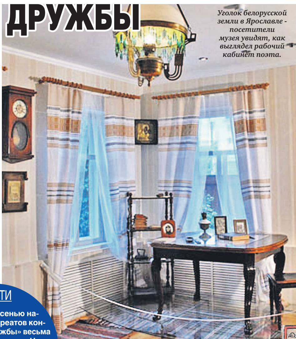
Уголок белорусской земли в Ярославле - посетители музея увидят, как выглядел рабочий кабинет поэта.

Свежий пример литературного сотрудничества - конкурс молодых литераторов «Мост дружбы». На презентации нового сезона эксперты говорили о том, как важно, что в нем участвуют авторы со свежим взглядом на жизнь. Конкурс проходит в пятый раз: за