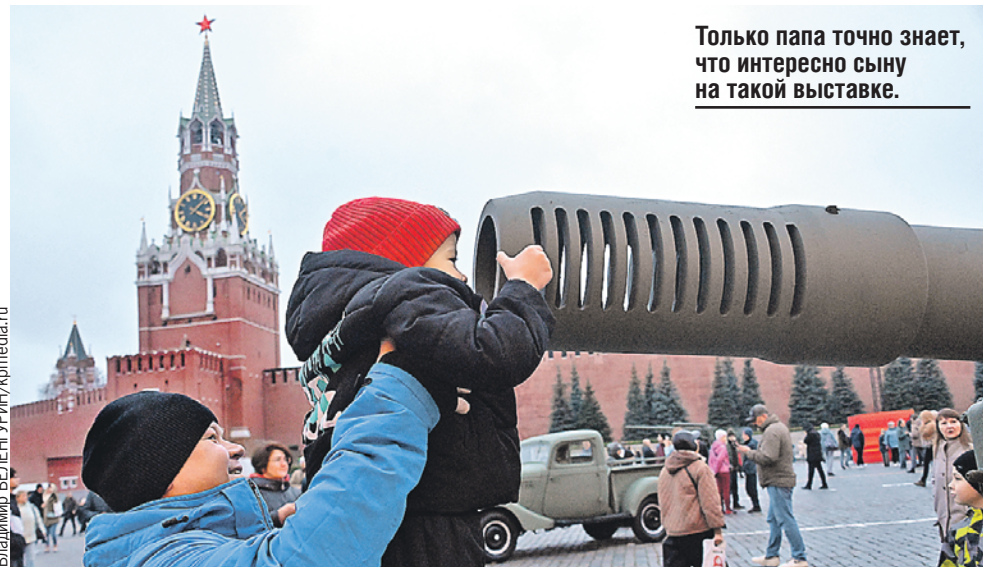
Только папа точно знает, что интересно сыну на такой выставке.