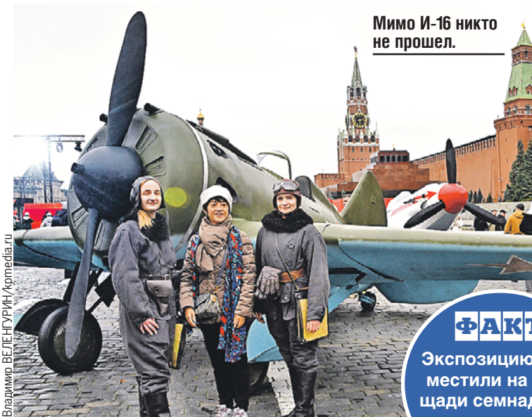
Мимо И-16 никто не прошел.