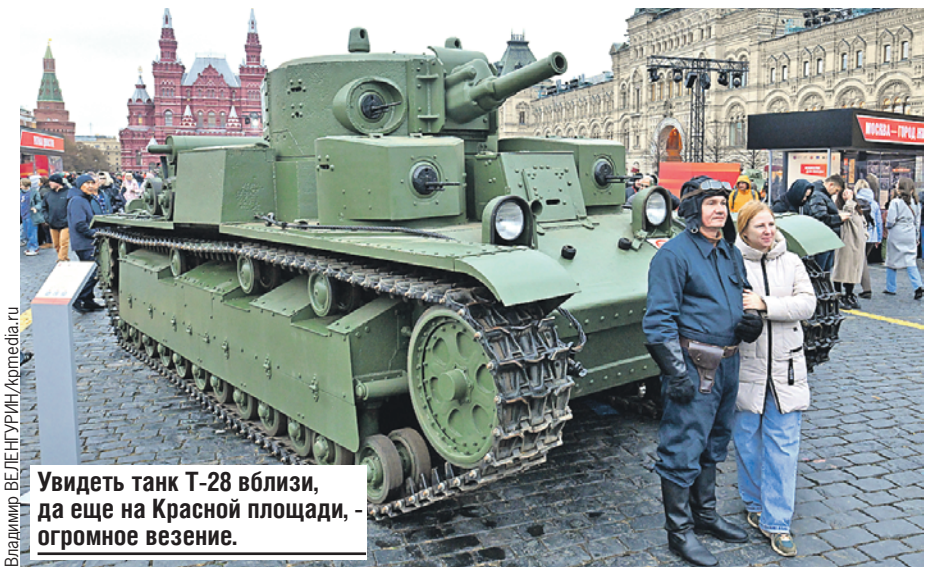
Увидеть танк Т-28 вблизи, да еще на Красной площади, - огромное везение.