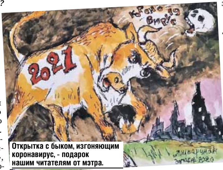
Открытка с быком, изгоняющим коронавирус, - подарок нашим читателям от мэтра.

- Сталина, когда ходили на демонстрацию на Красную площадь. На большом расстоянии. Это было 1 мая. Он стоял на мавзолее Ленина. А уже в послевоенное время, в 80-е годы, в командировке в Братиславе, видел Брежнева. Приехал на выставку наших работ мультипликации. Она проходила в Доме Советско-Чехословацкой дружбы. И туда же на съезд Коммунистической партии Чехословакии прилетел Брежнев. И директор музея ему меня представил. Пожимал ему