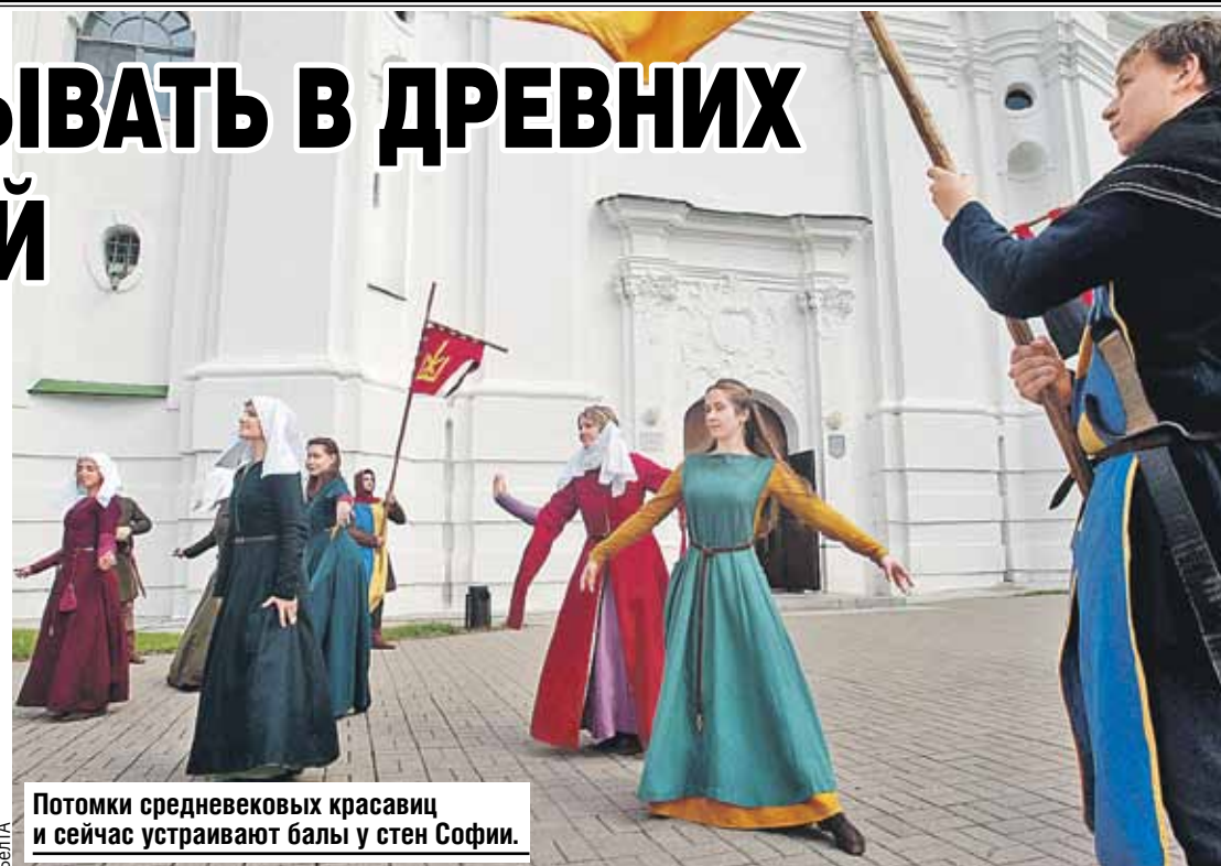
Потомки средневековых красавиц и сейчас устраивают балы у стен Софии.

ла супругой Владимира , до Александры Брячиславны - любимой жены Александра Невского . Не перевелись красавицы в Полоцке и в наше время. Искать их лучше всего на старинной Нижне-Покровской улице, рядом с которой находятся основные достопримечательности города - Софийский собор на крутом берегу Двины, оригинальный домик, где гостил Петр Первый , краеведческий музей и музей книгопечатания. Даже если невесту найти не удастся, удивительные культурные открытия точно гарантированы!