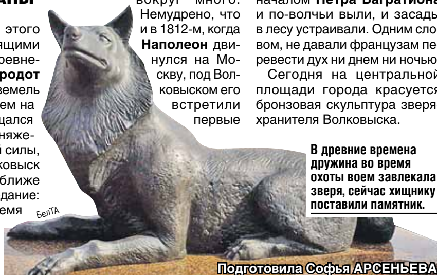
В древние времена дружина во время охоты воем завлекала зверя, сейчас хищнику поставили памятник.

Сегодня на центральной площади города красуется бронзовая скульптура зверя-хранителя Волковиска.