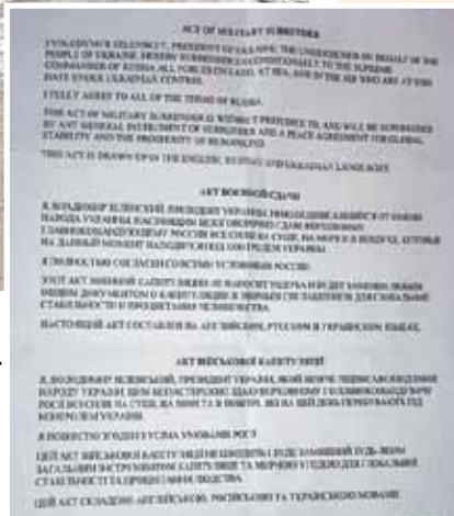
Подлинный автограф горе-президента.

Курьезнейший случай произошел с президентом Украины. Выяснилось, что беда пришла откуда не ждали - из самого Вашингтона, где бывший комик, по обыкновению, кланчил деньги и оружие. Один из работников обслуживающего персонала тоже, как оказалось, любит пошутить. Он попросил Зеленского поставить ему автограф на листе бумаги, что тот радостно и сделал. Однако выяснилось, что это был документ об украинской капитуляции. Шуточный, конечно, только подпись под ней поставил настоящий президент. Файл разместили на eBaу, где его уже купили за 1,5 тысячи долларов. Покупатель не прогадал, пророческая бумага наверняка еще вырастет в цене.