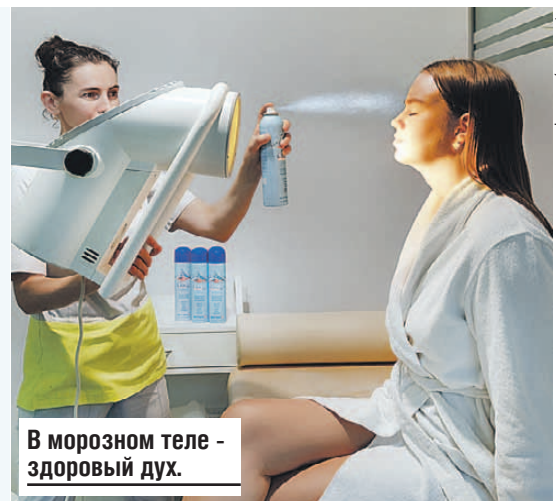
В морозном теле - здоровый дух.

После заездов вернуть организму силы и бодрость поможет традиционная дровяная баня. Тут же мангал. На ночь можно остановиться в уютных домиках-шалаше.