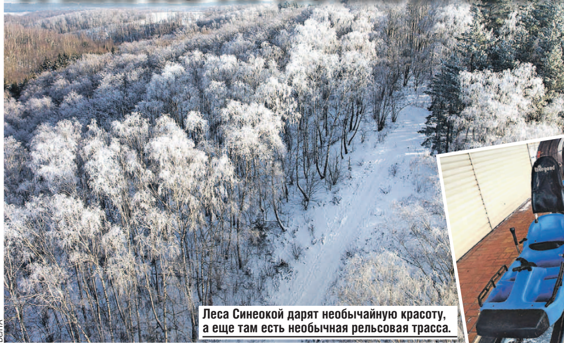
Леса Синеокой дарят необычайную красоту, а еще там есть необычная рельсовая трасса.