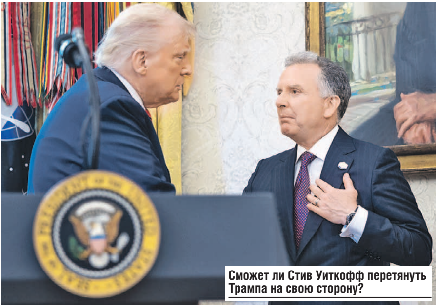
Сможет ли Стив Уиткофф перетянуть Трампа на свою сторону?