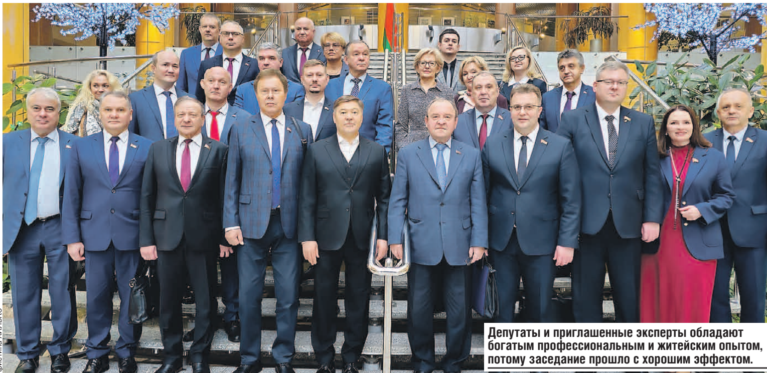
Депутаты и приглашенные эксперты обладают богатым профессиональным и житейским опытом, потому заседание прошло с хорошим эффектом.

- Хотелось бы, чтобы к моменту утверждения бюджета Парламентским Собранием