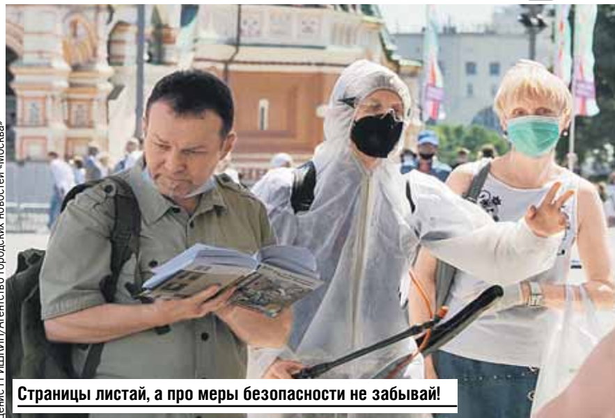
Страницы листай, а про меры безопасности не забывай!

ся в 2020-м и выпустил сборник эссе «Свободный полет».