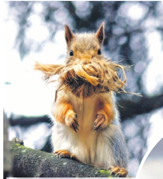
Белка надрала липового лыка, чтобы приготовить свое гнездо к холодам. Но сделала паузу в работе и позирует фотографу.