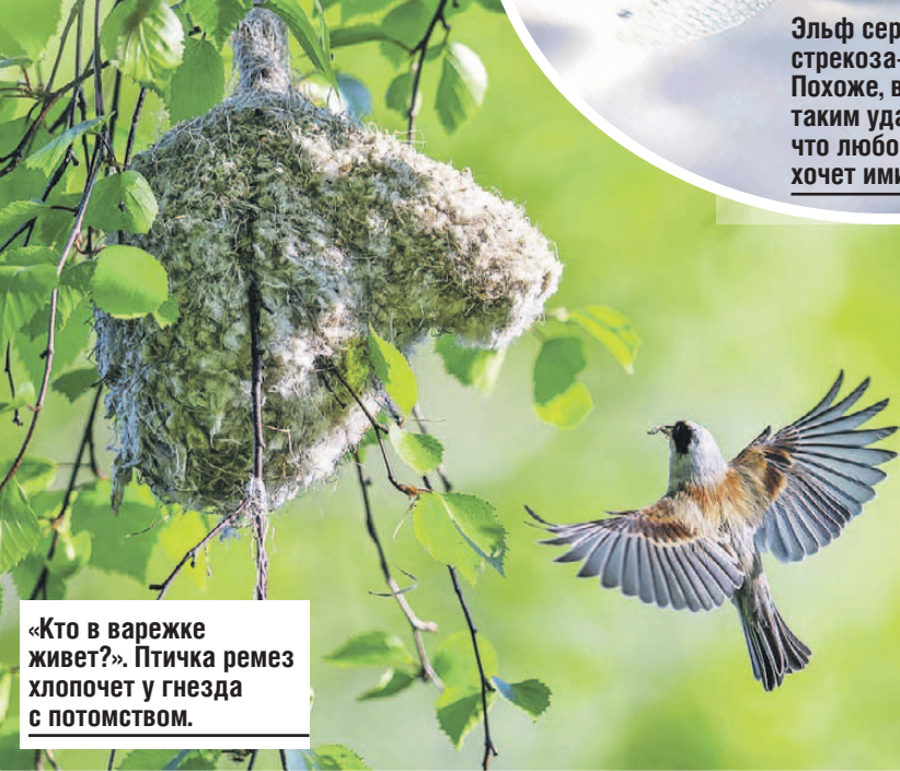
«Кто в варёжке живет?». Птичка ремез хлопчет у гнезда с потомством.