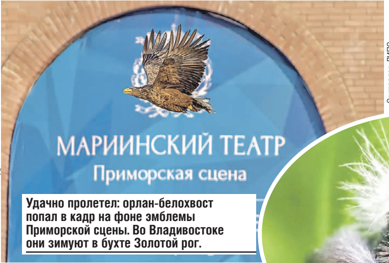
Удачно пролетел: орлан-белохвост попал в кадр на фоне эмблемы Приморской сцены. Во Владивостоке они зимуют в бухте Золотой рог.