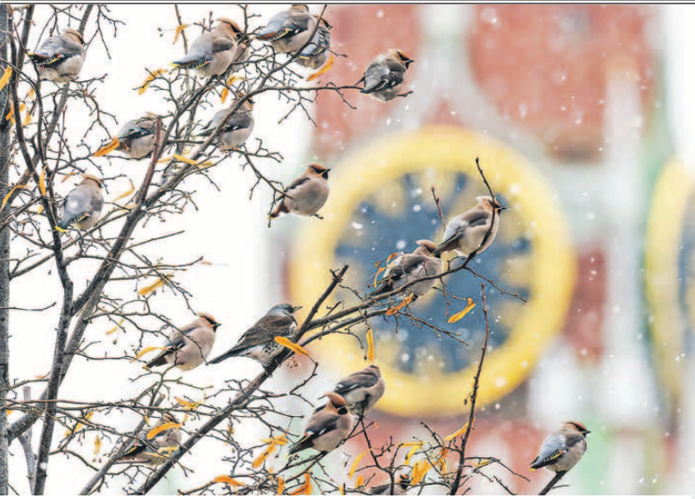
Гости столицы сверяют часы. Сотни пернатых оккупировали парк «Зарядье» в Москве и сметели всю рябину. На снимке - свиристели и затесавшийся среди них дрозд-рябинник.