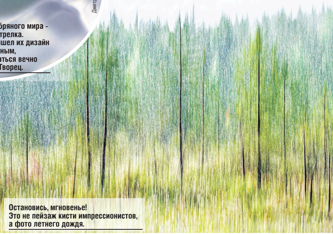
Остановись, мгновенье! Это не пейзаж кисти импрессионистов, а фото летнего дождя.