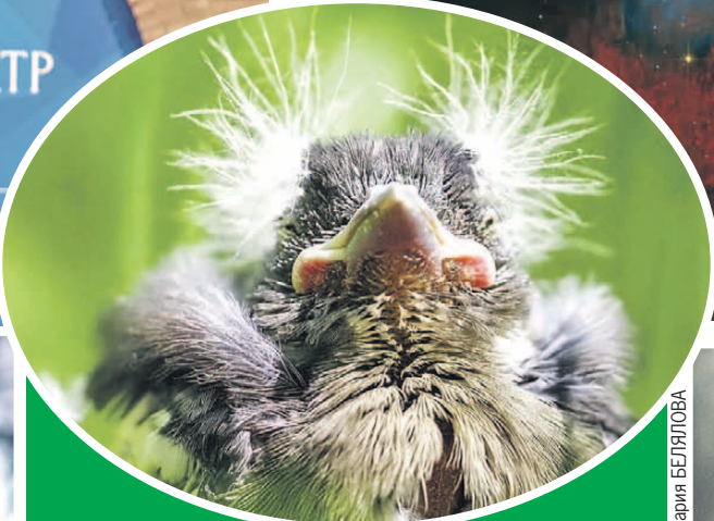
«Клоун» - так назвали фото забавного зяблика. Птичка сидела на асфальтовой дороге, по которой мчались велосипедисты и самокатчики. Автор аккуратно перенес зяблика в безопасное место, где его быстро нашли родители и продолжили кормление.