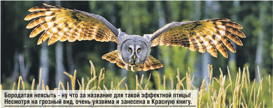
Бородатая неясыть - ну что за название для такой эффектной птицы! Несмотря на грозный вид, очень уязвима и занесена в Красную книгу.