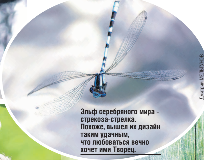
Эльф серебряного мира - стрекоза-стрелка. Похоже, вышел их дизайн таким удачным, что любоваться вечно хочет ими Творец.