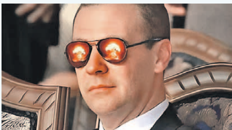
Известный мем с Дмитрием Медведевым вновь актуален.

считает себя президентом, следить за своими словами. Он вступает на очень опасную территорию!