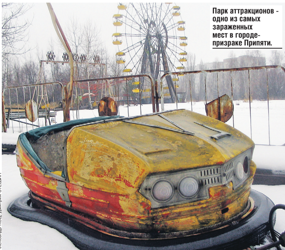
Парк аттракционов - одно из самых зараженных мест в городе-призраке Припяти.