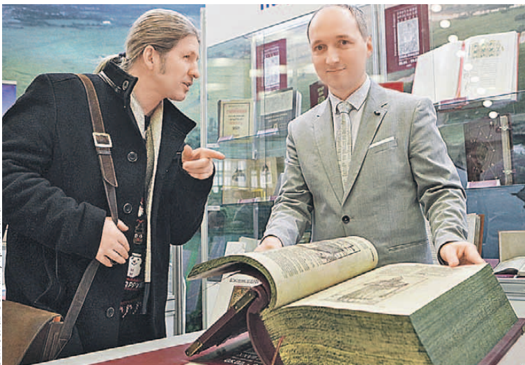
Особое внимание факсимильному изданию самой большой, красивой и дорогой белорусской книги - Брестской Библии 1563 года.

Спросом на российском стенде пользовались и новинки серии «ЖЗЛ», посвященные 75-летию Победы. Издатели привезли книги «Жуков», «Конов», «Рокоссовский», «Бер-