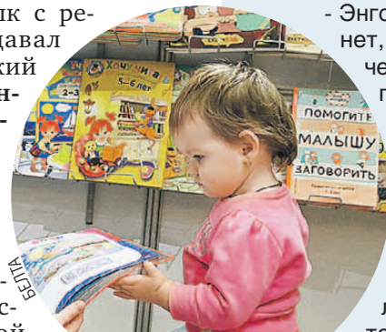
Для малышек организовали особую площадку с викторинами, мастер-классами, театральными постановками.