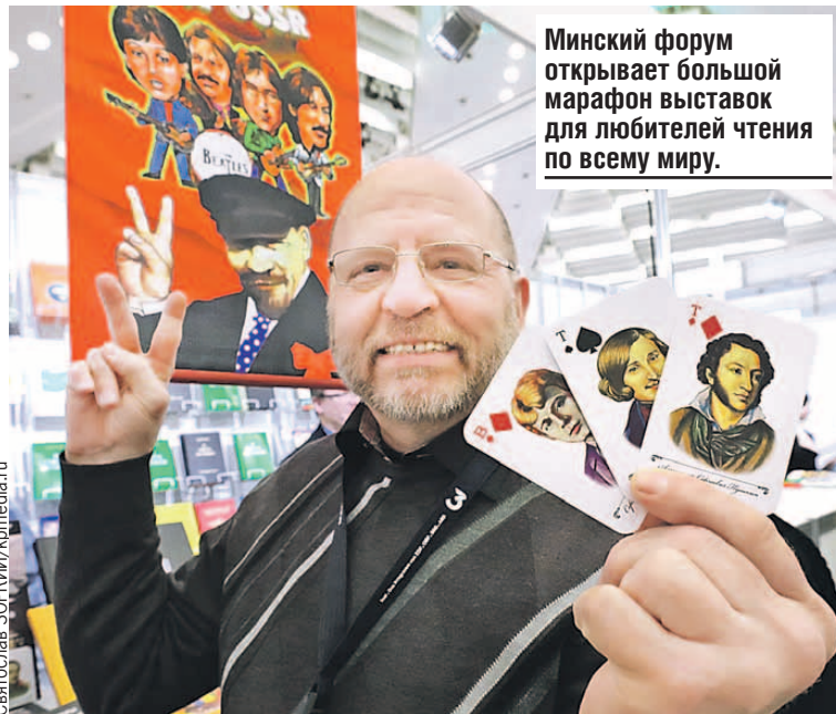
Минский форум открывает большой марафон выставок для любителей чтения по всему миру.

Родители с детьми с нетерпением ждали встречи с На-