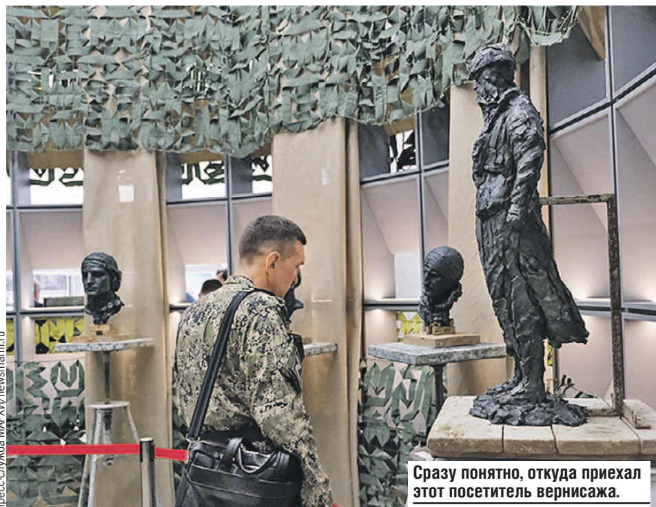
Сразу понятно, откуда приехал этот посетитель вернисажа.