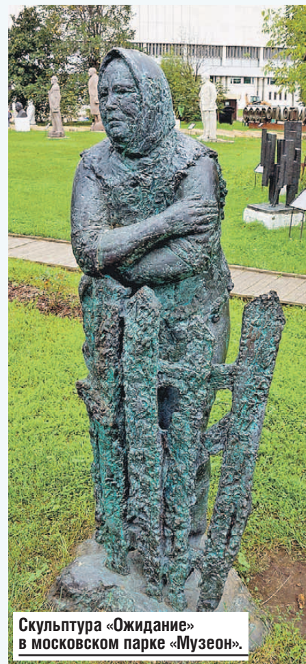
Скульптура «Ожидание» в московском парке «Музеон».