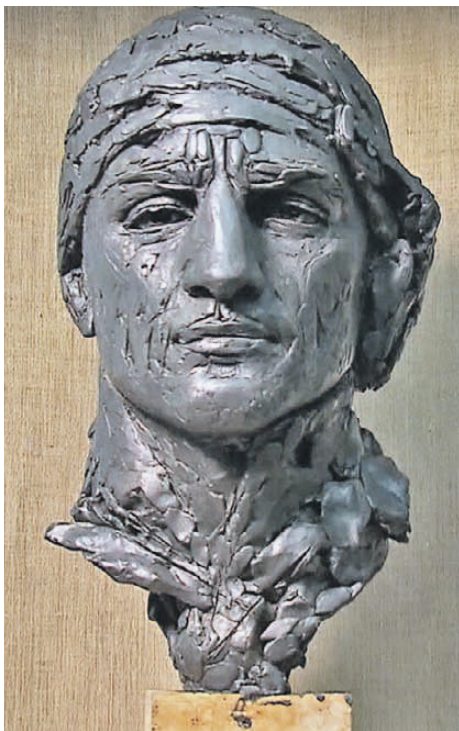
Бюст неустрашимого Нурмагомеда Гаджимагомеда.

■ В Москве прошла выставка, на которой представлены образы героев СВО из пластилина.