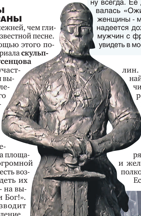
Собирательный образ защитника - в танковом шлеме и с мечом.

А вот чем-то похожий на римского сенатора комполка с позывным Ста-