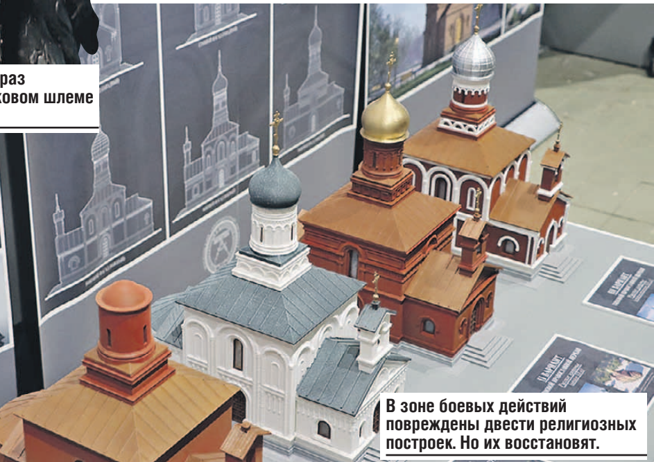
В зоне боевых действий повреждены двести религиозных построек. Но их восстановят.

Нашлось в экспозиции место и женщине. Это уже не собирательный образ, а конкретный. «Жена русского воина» - супруга бойца с позывным Большой. И у них, между прочим, десять детей.