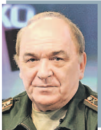
Михаил ПАНЮКОВ / Крпедиа.ру

- При этом у России, к счастью, в арсенале не только «Буревестник». - Россия, безусловно, вышла в аван-