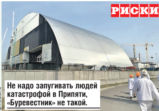
Не надо запугивать людей катастрофой в Припяти, «Буревестник» не такой.

При аварии на Чернобыльской АЭС разлетелось одновременно несколько десятков тонн высокорadioактивных продуктов деления урана. Такого количества radioактивных веществ не может получиться ни при каком взрыве ядерной или термоядерной бомбы. Даже знаменитая «Царь-бомба» - хрущевская «Кузькина мать» мощностью пятьдесят мегатонн,