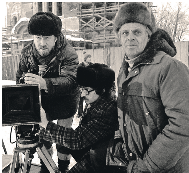
Режиссер (на фото справа) - дитя войны. Эта тема стала главной в его творчестве.

Человек он был очень эмоциональный, иногда резкий, но при этом скромный. И как же весело было с ним отдыхать!