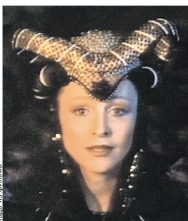
В роли Белой Сороки в фильме «Шляхтич Завальня, или Беларусь в фантастических рассказах», 1994 год.