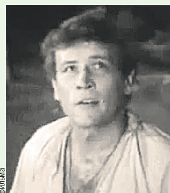
В роли Евхима в драме «Люди на болоте», 1981 год.

Туров был учеником Довженко и смысл искал во всем, не только в словах. После «Людей на болоте» я участвовал почти в каждой его картине. Он называл меня своим талисманом.