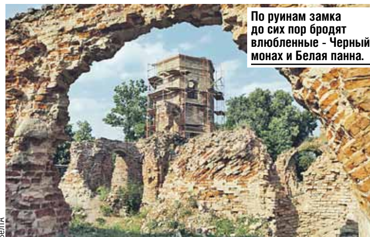
По руинам замка до сих пор бродят влюбленные - Черный монах и Белая панна.